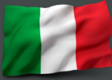
إيطاليا السيد أرنالدو مينوتي