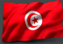
تونس الوزيرة حنين بن جراد