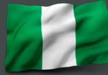
نيجيريا الوزير أبوبكر ملامي