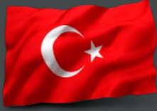
تركيا السفير نيفزات اويانيك