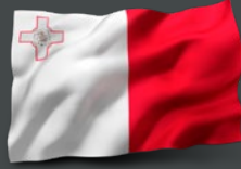
مالطا السيد كريستوفر كوتاجار