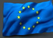
الاتحاد الأوروبي السيدة نادية كوستانتيني