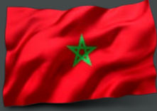
المغرب السيد اسماعيل الشكوري