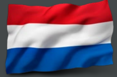
هولندا السيد هيوبرت يان ميناريندس