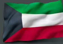
الكويت السفير حمد المشعان