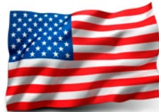
الولايات المتحدة الأمريكية