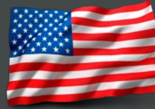
الولايات المتحدة الأمريكية كريستوفر أ. لاندبيرغ