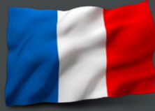
فرنسا السيد أدريان فريير